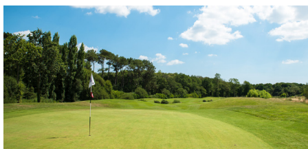
Golf de Guérande Route de Bréhador 44 350 Guérande