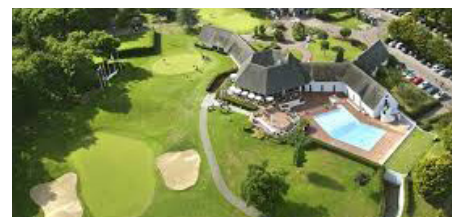
Golf Internationall Barrière La Baule Route de Saint Denac 44 117 Saint André des Eaux